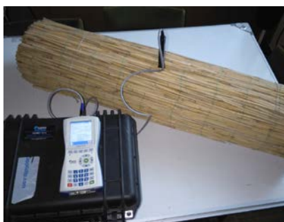
Slika 10. Měrenje toplotne provodljivosti \lambda ( W/mK ) kod trske u laboratoriji Građevinskog fakulteta u Subotici pomoću instrumenta Isomet 2014 sa iglastom sondom

U istoj Tabeli 1. je data vrednost toplotne provodljivosti za prošivenu trsku koja iznosi \lambda = 0,046 \text{ W/mK} , kod zapreminske mase koja je napisana da ima vrednost 800 \text{ kg/m}^3 . Autori ovoga rada su izmerili trščanu ploču debljine 10 cm i utvrdili da zapreminska masa iznosi 130 \text{ kg/m}^3 a toplotna provodljivost \lambda = 0,07 \text{ W/mK} .