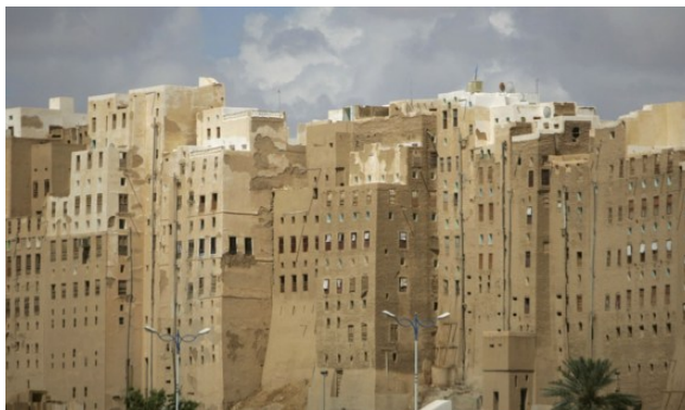
Slika 1. Stari soliteri od zemlje izgrađeni pre više vekova - grad Shibam u Jemenu

Najviše takvih gradnji ima u Africi, Aziji, Južnoj i Srednjoj Americi. Možda bi neko pomislio da se tamo nalaze siromašne zemlje i siromašni narodi. Siromaštvo nije razlog za takvu gradnju već klimatsko podneblje sa visokim temperaturama i visokom relativnom vlažnošću. U takvim podnebljima postoje samo dve alternative za život ljudi u stambenim objektima: