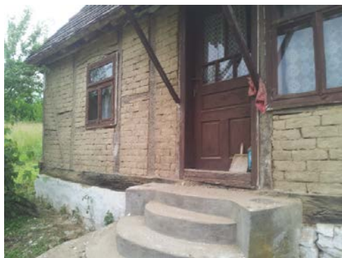
Slika 2. Kuća građena u Bondruk sistemu sa kombinacijom drvenog skeleta i čerpića od nepečene gline

Klimatizacija preko zidova stambenih objekata je korišena i dokazana kroz više vekova. Ovaj način klimatizacije pruža najbolji ugođaj za čoveka. Niti jedan drugi način, veštačka klima ili slično, ne može da obezbedi takav ugođaj kao prirodna klimatizacija preko zidova i tavanica. Prvi uslov koji moramo ispoštovati za prirodnu klimatizaciju je da zidove objekata napravimo sa takvim materijalima koji su higroskopni i parodifuzni. Drugi uslov je da na takve zidove ne smemo postaviti nikakve materijale koji bi tu parodifuznost sprečili ili otežali. To znači da moramo voditi računa da čak i farbe na zidovima moraju biti paropropusne. Primeri gradnje sa nepečenom glinom i drugim prirodnim materijalima postoje i u Evropi, pa tako i u R.Srbiji.