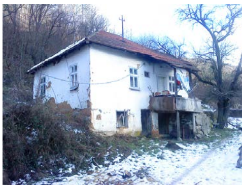
Slika 6. Kuća na Staroj planini koja je i sama stara više vekova a građena je sa nabojem od nepečene gline

Zidovi i kuće od nepečene gline pored mnogih prednosti koje su ovaj materijal i način gradnje zadržali do danas, postoje i nedostaci. Osnovni nedostatak je slaba otpornost na delovanje vode i povećanja vlažnosti zidova. Voda i visoka vlažnost raskvašavaju nepečenu glinu što može da ugrozi stabilnost celog objekta. Ovaj nedostatak se praktično otklanja na način da se takvi objekti ne trebaju i ne smeju graditi u poplavnim područjima. Navedeni nedostatak ne sme i ne može predstavljati razlog da se nepečena glina kao materijal i način gradnje zabrani ili na bilo koji drugi način ograničava jer su prednosti daleko iznad nedostataka. Na žalost može se steći utisak da se ovaj materijal u R.Srbiji ne smatra dovoljno dobrim za gradnju.