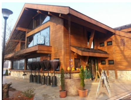
Slika 4. Objekat građen sa drvenim elementima zidova i krovova koji već svojim spoljašnjim izgledom pleni svojom lepotom i toplotom – Sunset caffe Beograd

Drvo je materijal koji ima dobre termoizolacione karakteristike, što je danas vrlo bitno, zbog trenda podizanja energetske efikasnosti kod građevinskih objekata. Mehaničke karakteristike drveta su na zavidnom nivou u odnosu na druge materijale i one zavise od stanja vlažnosti samog drveta. Nedostaci drveta kao građevinskog materijala su relativno visoka cena i stalna potreba za zaštitom drveta od insekata i fungi (gljiva). Najveći nedostatak drveta je slaba protivpožarna otpornost. Primena drveta kod građenja stambenih objekata nikada nije prestajala i pored navedenih nedostataka, drvo je jedan od materijala za koje je čovek najviše vezan.