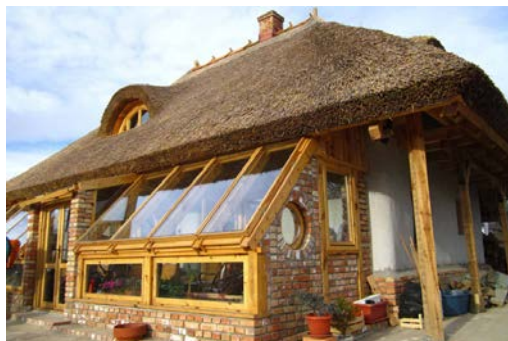
Slika 8. Prelepa kuća visoke energetske efikasnosti gde su zidovi urađeni sa slamom a krov je prekriven trskom

imaju veliku prednost pred mnogim drugim materijalima po tom pitanju jer imaju mnogo bolje termotehničke karakteristike.