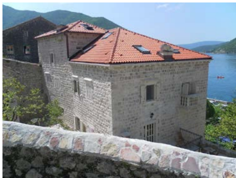
Slika 5. Kuća od kamena u Perastu (Crna Gora) stara 400 godina, pod zaštitom UNESCO, sanirana je po pitanjima nosivosti i sigurnosti i zadovoljava visoke standarde energetske efikasnosti