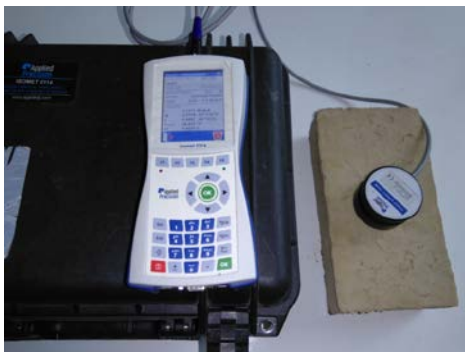
Slika 7. Merenje toplotne provodljivosti kod čerpića kao elementa od nepečene gline koji su napravili studenti Građevinskog fakulteta u Subotici

Izmerena vrednost toplotne provodljivosti kod čerpića upućuje na zaključak da je ovaj materijal vrlo dobar termoizolator. Ova vrednost može biti i nešto niža i na tome radimo kao autori ovoga rada, zajedno sa našima studentima u okviru nastavnih predmeta, na Građevinskom fakultetu Subotica – Univerziteta u Novom Sadu i na Građevinskom fakultetu Beograd – Univerziteta Beograd.