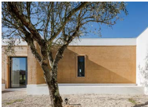
Slika 3. Primer gradnje novog objekta sa nepečenom glinom u Portugalu

Tako se gradilo nekada a gradi se i danas, sve više u Evropi, gde bogati ljudi, sa dobrim finansijama grade svoje stambene objekte od nepečene gline u obliku naboja ili zidane objekte sa elementima od nepečene gline, popularnim čerpićem.