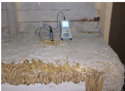
Slika 9. Měrenje toplotne provodljivosti \lambda ( W/mK ) pomoću instrumenta Isomet 2014 sa iglastom sondom u modelu zida sa baliranom slamom koji su uradili studenti Građevinskog fakulteta iz Subotice