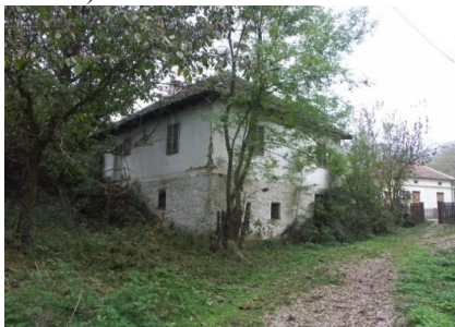
Слика 1. Напуштена породична кућа