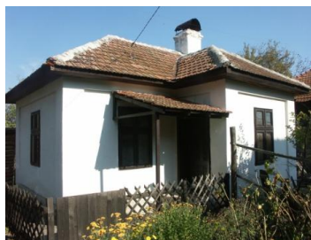
Слика 4. Породична кућа где живе власници