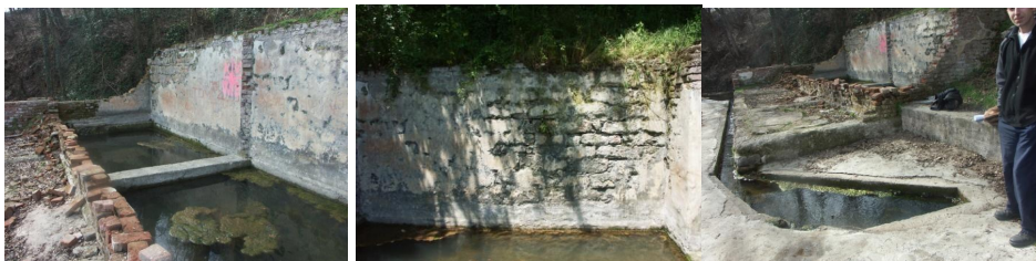
Слика 7,8,9. Представљају изглед и стање базена пре интервенција, види се запустелост и оштећења на зидовима базена

Базен се налази у близини извора Тимока, добија воду са извора топле воде и представљају право богатство за руралну средину. Месна заједница Кривог Вира је у сарадњи са општинским структурама Бољевца предвидела активности за реконструкцију Базена топле воде.