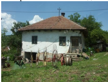
Слика 3. Кућа која се повремено користи

Приказане куће су „куће бондручаре“ саграђене на каменим темељима од дрвене конструкције са испуном од земље. Конструкција бондручаре се види код воденице – подрум је озидан од камена и прати пад терена а партер је урађен од дрвене конструкције са испуном од земље (слика 2.). Кров је покривен ћерамидом. Воденица је још увек у функцији и може по потреби да меље жито; одмах се намеће функционисање воденице са производњом органске хране и радним местом за једну особу – посао за маргинализовано становништво села, што би истовремено била и свакодневна атракција за туристе .