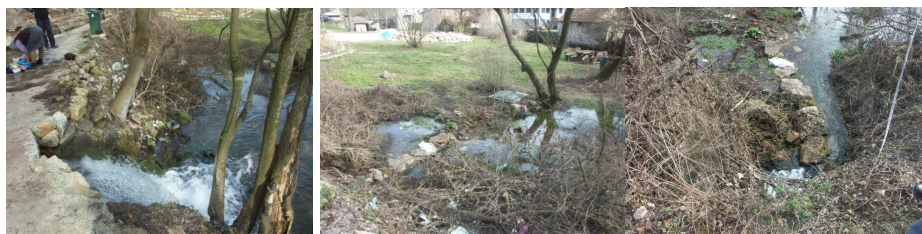
Слике 10,11,12. Показују парцелу поред базена која се налази под сталним протоком воде из базена где ће се градити плажа

Укупна количина воде из базена се прелива и преко канала отиче око базена да би се спојила са водом која протиче кроз базен. Та количина воде се поново дели и једним делом отиче на нижи терен поред базена, денивелација од 1,80м, а други део отиче каналом који се пружа поред стазе. (слике 10., 11., 12.). На том нижем терену је предложена изградња плаже. Вода која отиче каналом поред стазе наставља до воденице која се налази низводно поред Тимока (слика 2.).