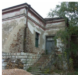
Слика 5. Фасада напуштене Основне школе Слика 6. Главни улаз у Основну школу