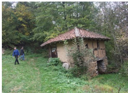
Слика 2. Воденица –повремено се користи

Приказане куће су „куће бондручаре“ саграђене на каменим темељима од дрвене конструкције са испуном од земље. Конструкција бондручаре се види код воденице – подрум је озидан од камена и прати пад терена а партер је урађен од дрвене конструкције са испуном од земље (слика 2.). Кров је покривен ћерамидом. Воденица је још увек у функцији и може по потреби да меље жито; одмах се намеће функционисање воденице са производњом органске хране и радним местом за једну особу – посао за маргинализовано становништво села, што би истовремено била и свакодневна атракција за туристе .