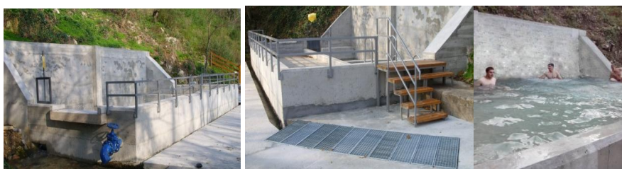
Слика 15,16,17. Изглед реконструисаног Базена проточне топле воде

Пројекат је изведен делимично јер је остала још изградња плаже; према пројекту предвиђена је дрвена конструкција носача преко које се поставља под од талпи.