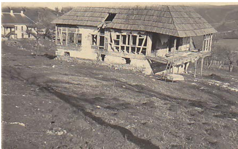
Слика 02. Конак сердара Јована Мићића саграђен почетком 19. века Figure 02. House of serdar Jovan Mičić built at the beginning of 19th century