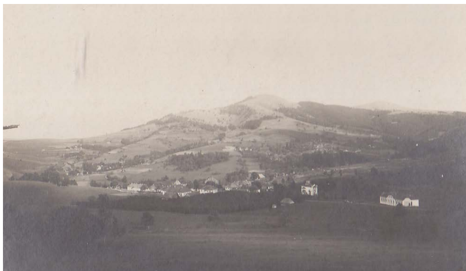
Слика 03. Чајетина око 1916. године Figure 03. Čajetina, about 1916.