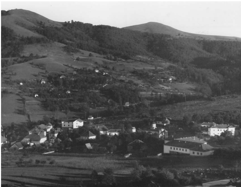
Слика 06. Чајетина, око 1950. Figure 06. Čajetina, about 1950.