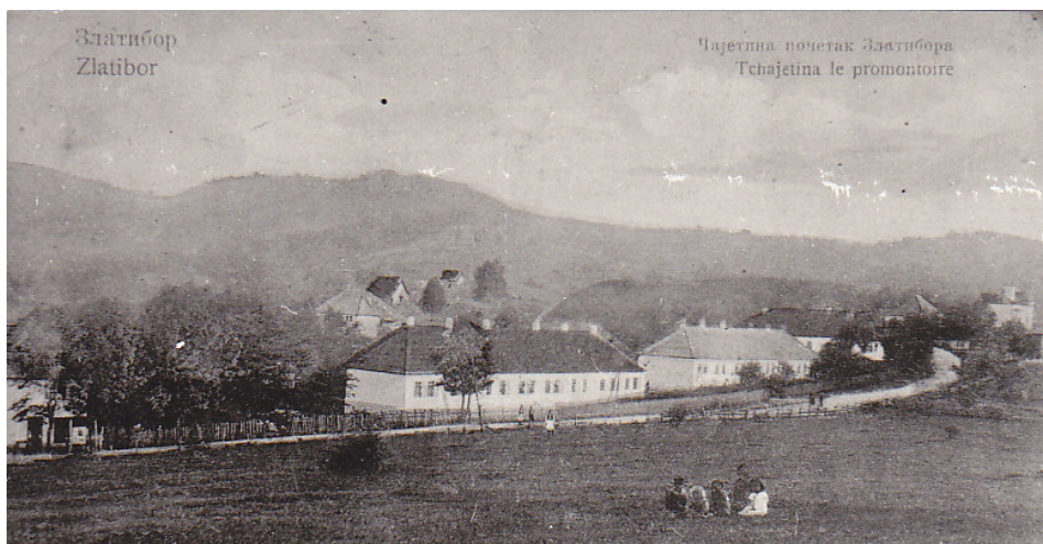
Слика 05. Чајетина, око 1920. године Figure 05. Čajetina, about 1920.