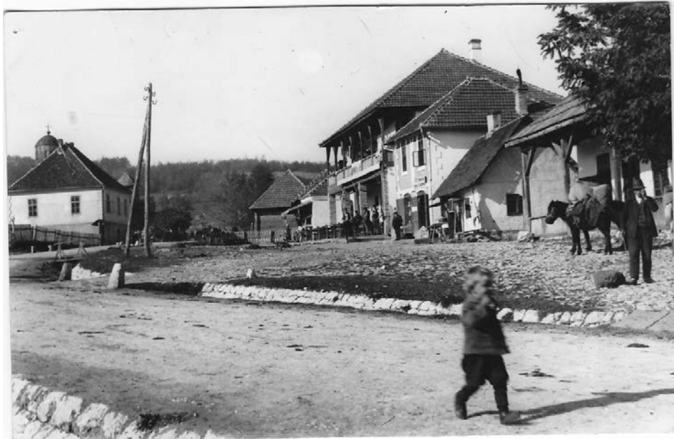
Слика 04. Чајетина, око 1920. године Figure 04. Čajetina, about 1920.