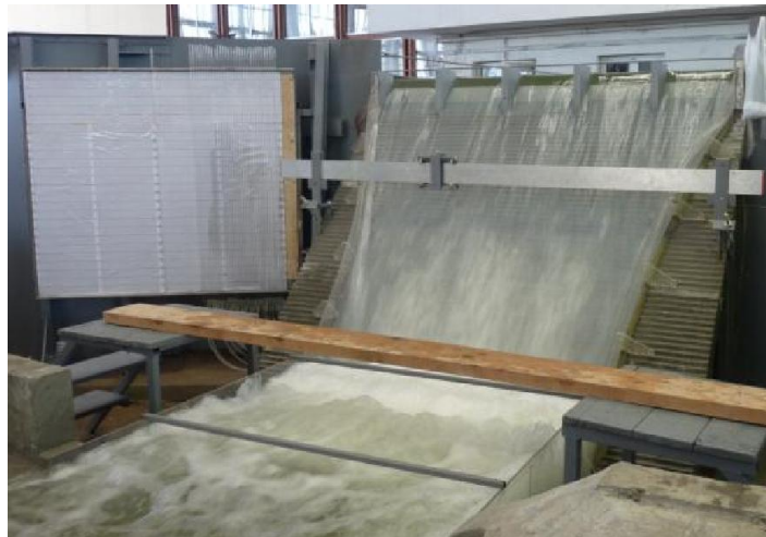
Слика 1. Физички модел бране Бузина, Хидрауличка лабораторија Института за водопривреду "Јарослав Черни"

Физички модел бране Бузина, у размери за дужине 1:40 (Слика 1), изграђен је у хали Хидрауличке лабораторије Института за водопривреду „Јарослав Черни“, у Београду, током јануара и фебруара 2013.године.