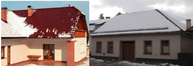
Слика 4. Пример равномерног отапања снега коришћењем додатне опреме (снегобрана и решетке)

Снегобрани спречавају неконтролисано клизање снега са крова, а уједно и равномерним отопљавањем снега продужују трајност кровног покривача.