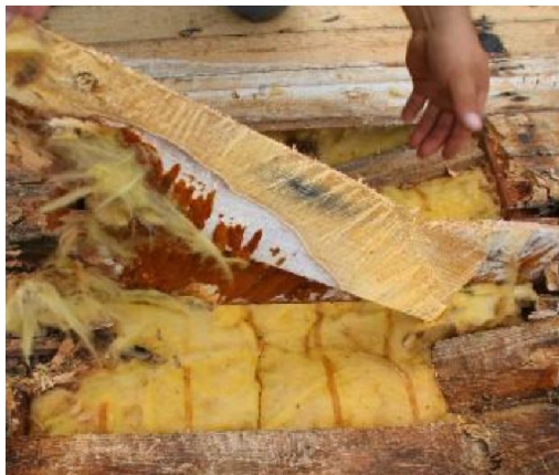
Слика 7. Проблеми са кондензацијом воде у минералној вуни приликом неправилне термоизолације косог крова

У случају када се појави вода у ВТМ, коефицијент пролаза топлоте крова се може повећати неколико пута, што значи велике губитке топлоте, а поред тога и пропадање кровне конструкције.