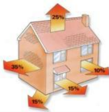
Слика 6. Расподела топлотних губитака на стамбеним објектима [7]

може се закључити да са аспекта енергетске ефикасности објеката термоизолација кровова је од великог значаја. То су места са најмоћнијом термоизолацијом на нашим објектима или места где постављањем термоизолације постижемо значајне ефекте у смањењу топлотних губитака.