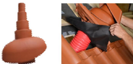
Слика 3. Савремена решења продора кроз кров: антенски наставак (лево) и вентилациона цев (десно)

Експлоатациони век старог крова у случајевима када се цреп још не распада и љуска се може продужити одржавањем добро изведене целокупне конструкције крова. Искуства су показала да се проблеми прво јављају не на средини кровне равни, него на ободима и поред елемената који продиру кроз кров. После јачег ветра и отопљавања снега визуелним прегледом, слемена, гребена и забата, лимова у увалама, поред димњака или на забату могу се избећи већи проблеми, оштећења летви и кровне конструкције. Постоје већ савремена решења продора кроз кров, чија примена, тј. замена старог решења новим обезбеђује околину ових деликатних места.