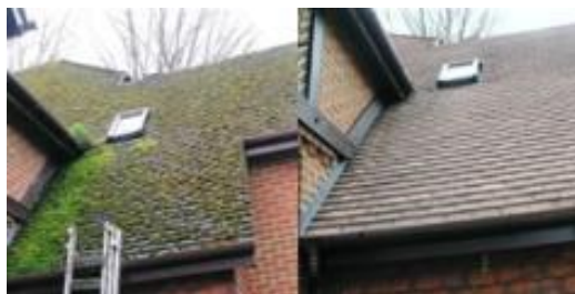
Слика 2. Примена заштитног хидрофобног премаза (слика: HYDROBLOCK)

У новије време се све више користе разни начини заштите кровних покривача. У последње време развојем нанотехнологије појавили су веома ефикасни заштитни премази – хидрофобни пенетрати, који затварањем пора на црепу пружају заштиту не само од прашине и појаве алги, већ дубинским пенетрирањем и заустављањем продирања воде повећавају и отпорност на мраз. Резултат примене ове врсте санације кровног покривача зависи од више фактора (степен примарног оштећења кровног покривача, врста кровног покривача, у којој мери су црепови очишћени од нечистоће и лишајева, итд...)[2].