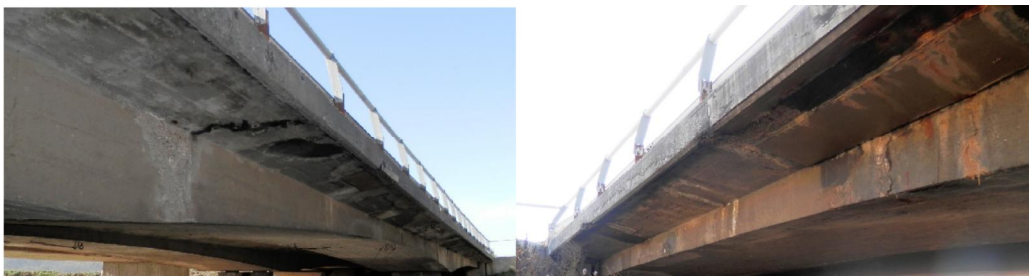
Слика 6,7. Оштећења конзолних препуста на мосту

Нови тип одбојне оградe, која је по тренутно важећим прописима и ниво оштећења конзолних препуста на потојећим конструкцијама довели су до потребе за делимичним рушењем конзолних препуста и поновним бетонирањем у складу са новим захтевима.