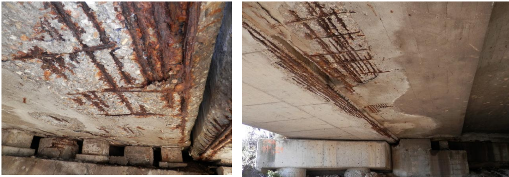
Слика 4,5. Оштећења на мосту