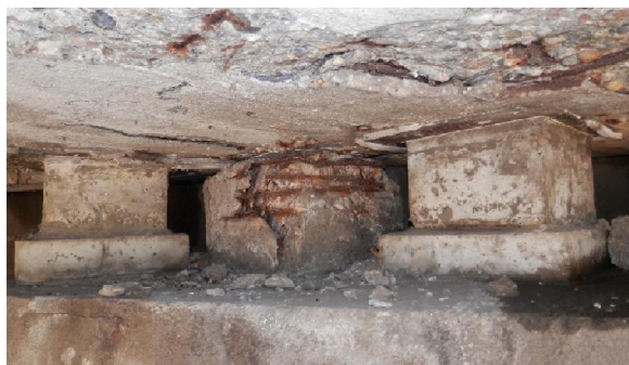
Слика 1,2. Оштећења на мосту