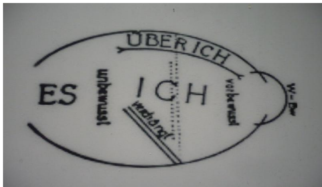
Slika 3. Freud-ova teorija o mozgu