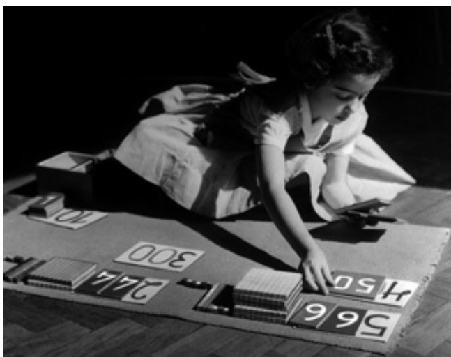
Slika 4. Marija Montesori metoda: „Pomozi mi da to učinim sam”.