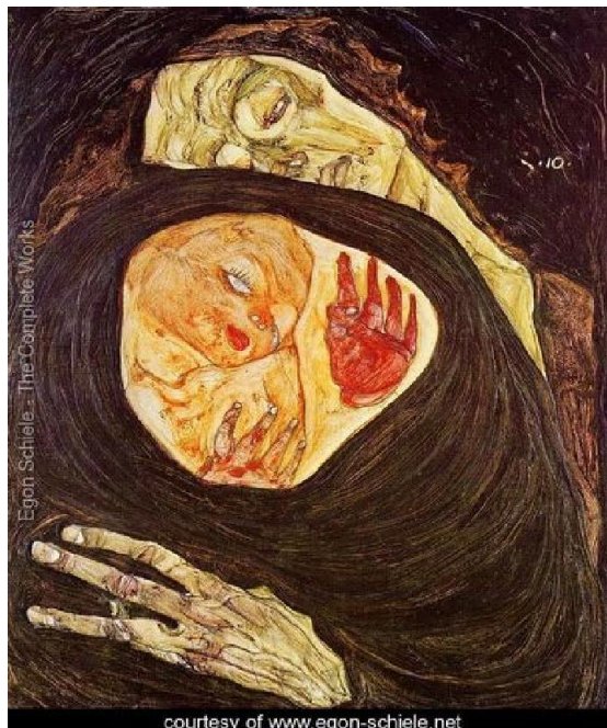
Slika 1. Majka sa detetom (Schiele)

Na njenoj nadgrobnoj ploči piše: „ Molim decu koja su puna snage da se ujedine sa mnom kako bi se uspostavio mir u čoveku i u svetu. “