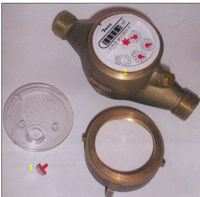
Slika 1 – Indikator (1) pre montaže na vodomer opremljen za daljinsko očitavanje sistemom ADO RF 24, proizvodnje „Inse” iz Zemuna [6] 2 – skala za prikazivanje protekle zapremine vode u decilitrima

Utvrđivanje potrošnje vode olakšava korišćenje vodomera opremljenog za daljinsko očitavanje. Princip daljinskog očitavanja je ugradnja indikatora u vodomer koji na osnovu okretanja propelera vodomera meri proteklu zapreminu vode [8, 88]. Kod sistema daljinskog očitavanja ADO RF 24, proizvodnje „Inse” iz Zemuna, indikator je ugrađen na mesto kazaljke na skali za prikazivanje protekle zapremine vode u decilitrima [6].