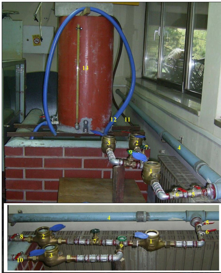
Slika 2 – Instalacija za bilansiranje vode vodomerima u sistemu vodovoda u Hidrauličkoj laboratoriji Građevinskog fakulteta u Subotici, 1- 3 – vodomeri, 4 – vodovod, 5-10 – propusni ventili, 11-12 – odvodna creva, 13 – bure

U instalaciju za bilansiranje vode u sistemu vodovoda ugrađeni su novi, baždareni višezlazni propelerni vodomeri sa mokrim mehanizmom, za vodu temperature do 30 °C, nazivnog prečnika 20 mm, klase B, najvećeg i najmanjeg protoka 3 i 0,06 m 3 /čas. Ugrađena su tri vodomera.