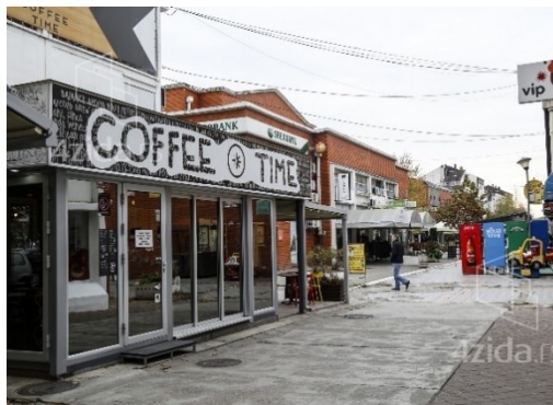
Слика 3. Кафе у Кнез Михаиловој улици у Београду и кафе ван историјског језгра Београда