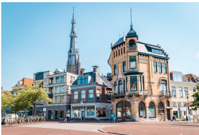
Слика 6. Ново коришћење наслеђа адаптацијама у градињу Лееуардену, Холандија (према https://wherewouldyogo.com/destinations/europe/3-days-leeuwarden-the-netherlands/ )

Посебно истраживање односи се на трансформацију размишљања како се сећање може одржати у оквиру карактеристика које утичу на активне процесе промена и материјалне трансформације. Упоредо са овом трансформацијом истраживање се усмерава и на управљање градитељским наслеђем и променљивим пејзажима (Слика 6) [14].