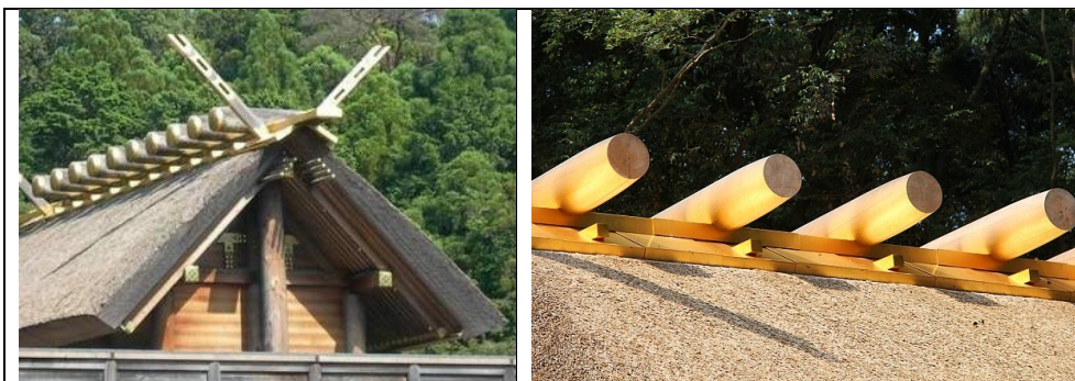
Слика 9. Велико Исо светилиште, Исе, Јапан, изглед и замена крова (према https://www.japan-experience.com/city-ise/ise-grand-shrine-naiku и https://www.japan-guide.com/blog/schauwecker/130709.html )

Ово решење свакако ће у будућности користити и друге земље у којима постоје слични проблеми са градитељским наслеђем везаним за ритуале, симболе и митове. Овај приступ замене оригиналног материјала већ је признат у случајевима културног наслеђа од набијене земље и черпића, када се вреднује и штити оригиналност просторне структуре. Јапански пример заштите места као нематеријалног наслеђа свакако ће служити као водич за могуће конзерваторске поступке сакралне архитектуре (Слика 9)