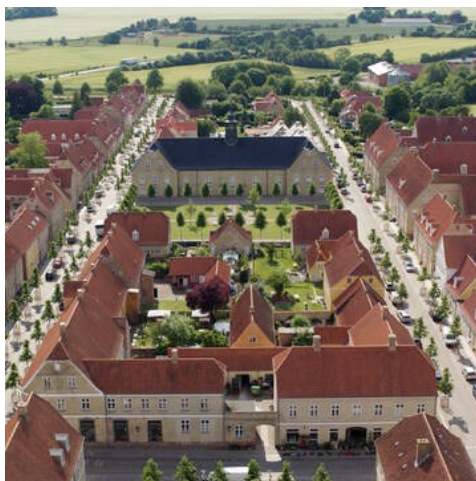
Слика 8. Кристијансфелд, Данска, Светско културно наслеђе

У заједницама које се супротстављају брзим променама и модернизацији растући темпо промена, подстакнут сталним унапређењем електронских комуникација, утицаће на продор идеја којима ће однос наслеђа и савременог стваралаштва бити боље избалансиран. Можда је најважнији проблем који се уочава конфликт који настаје између традиционалних вредности верских заједница и циљева савремене конзервације. Савремена конзерваторска доктрина полази од савремених секуларних вредности, па се услед тога ствара напетост између традиционалних верских вредности и темељних вредности савременог живота. Ова ситуација је на успешан начин превазиђена у случају Кристијансфелда, градића у Данској. Градитељско наслеђе овог градића припада Моравској хришћанској заједници. Иако је било у националном систему заштите, о њему се старала верска заједница. Опадањем броја верника изостајала су и средства за бригу о наслеђу, па се заједница усмерила на сарадњу са секуларним ауторитетима. Резултат је опште задовољство и верске заједнице, јер је 2015. године Кристијансфелд уписан као једино место у Данској на УНЕСЦО листу Светског наслеђа, и секуларне власти којима је прилив туриста донео економску добит и понос. Овај вид кооперације је веома повољно оцењен и брзо се шири на Холандију, Велику Британију, Немачку, Америку, Јужну Африку.