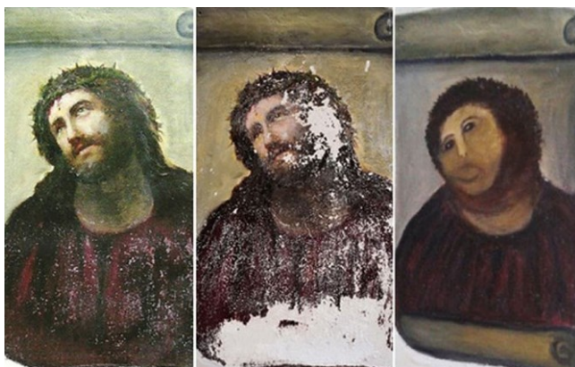
Слика 7. Фреска Христа коју је одана парохијанка сама рестаурисала на зиду цркве у Борји код Зарагозе у Шпанији, позната као “Мајмунолики Христ”