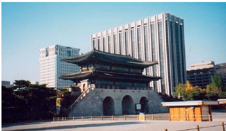
Слика 1. Улаз у Гвенгбокгунг палату окружену модерним зградама, Сеул, Јужна Кореја – негативан визуелни доживљај

Скоро два века, друштво је "производило" наслеђе од грађевина и других дела из прошлости, све док није достигло фазу у којој скоро све оно што је човек створио постаје нешто што ће се поседовати као да је наслеђено. То је постајало предмет носталгије, музејски експонат, предмет очувања путем разних метода којима је могуће заштити разне облике градитељског наслеђа (Слика 1)