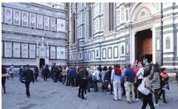
Слика 5. Туристи чекају ред да уђу у Цркву Санта Мариа деи Фиори у Фиренци

За будућност наслеђа отвара се и питање да ли наслеђе поштује историју или је понекад злоупотребљава? Све више се повезују друштвени и културни простори, па је наслеђе као изграђено окружење често кључни аспект у туристичкој индустрији [11]. Нагласак је, наравно, на визуелности, на ритуал разгледања и снимања наслеђа. У погледу визуелности наслеђе се не посматра само као иконографија, већ као битна компонента просторне трансформације и стварања места које ће бити темељ културном туризму. У тај процес се укључују маркетинг и промоција како би се одезбедио идентитет места. Овде је углавном реч само о спољашњој визуелизацији наслеђа у културном пејзажу, па је туристички контекст очигледан [12]. Наслеђе, међутим, превазилази учешће у туризму у подручју афективних и симболичних ангажмана, већ се повезује са људском и културном географијом, усмеравајући пажњу на истраживање концептуалног оквира између тог наслеђа и политике идентитета засноване на историјском месту (Слика 5).